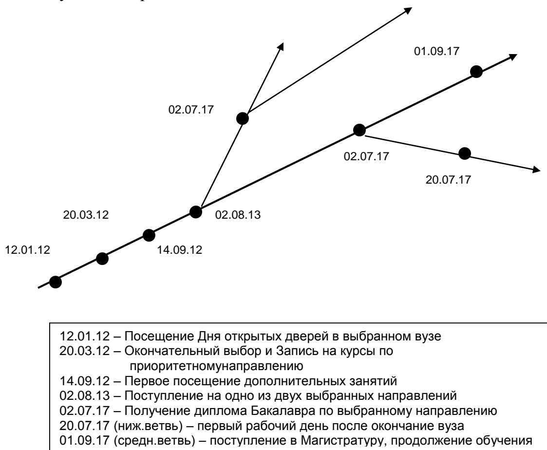
Рис.4 Фрагмент «дерева» профессионального маршрута

На последних встречах подросток совместно с психологом подробно прописывает все шаги, которые ему еще необходимо будет предпринять, чтобы стать профессионалом в выбранной области. Выглядеть это может примерно следующим образом. Рис.4